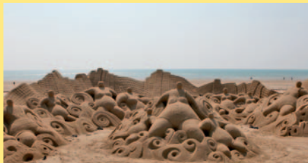
Kid's Folies 2010